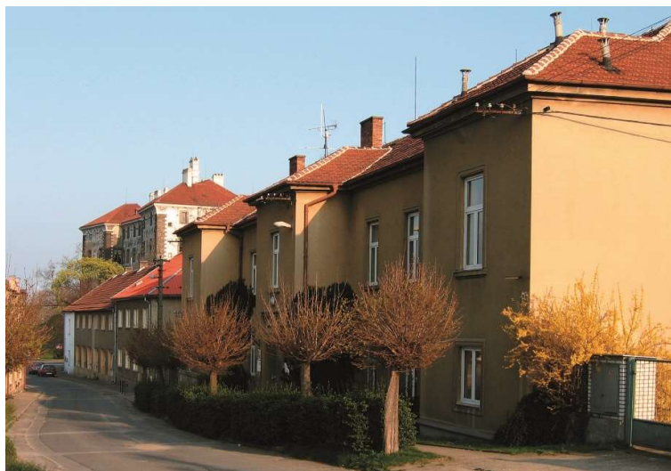
Základní škola Nelahozeves, okres Mělník